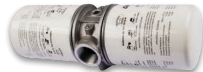
Filtre de retour pour montage en ligne