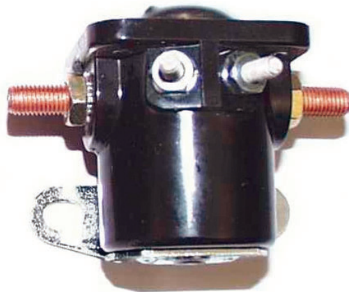
Relais - alte Version